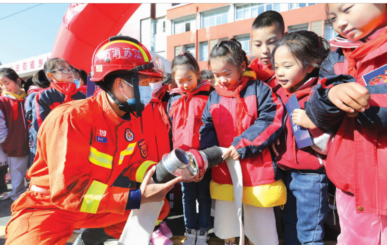
11月8日，江苏连云港市云中中心小学的学生在消防人员指导下体验使用消防器材。

《逐冰追雪》《奥林匹克人》等节目深度挖掘奥林匹克运动和文化精神内涵。《奥秘无穷》节目