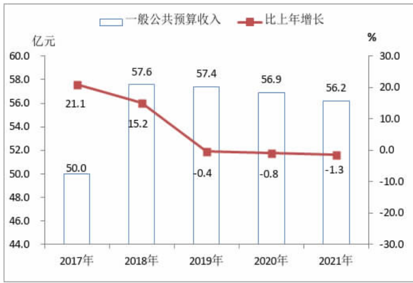
圖7 2017年-2021年全市一般公共預算收入及其增長速度

一般公共預算支出129.2億元,比上年下降16.2%。其中,一般公共服務支出增長8.6%,公共安全支出下降9.9%,教育支出下降0.3%,科學技術支出增長29.1%,社會保障和就業支出增長9.4%,衛生健康支出增長1.3%,節能環保支出下降40.2%,城鄉社區支出下降53.4%。