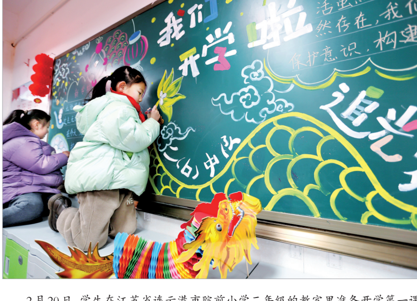
2月20日,学生在江苏省连云港市院前小学二年级的教室里准备开学第一课板报。当日,江苏各中小幼儿园迎来返校报到日,师生们相聚校园,领取新课本,举办丰富多彩的活动,迎接新学期的到来。