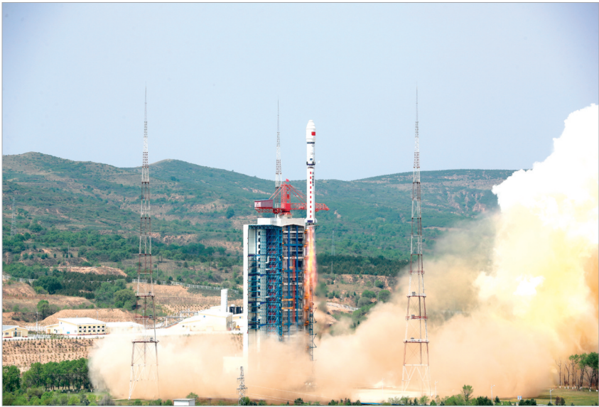
5月20日11时06分，我国在太原卫星发射中心使用长征二号丁运载火箭，成功将北京三号C卫星发射升空，4颗卫星顺利进入预定轨道，发射任务获得圆满成功。

博物馆讲解员莫色洛务声情并茂地说：“从奴隶社会直接过渡到社会主义社会，凉山一步跨千年；而今从脱贫攻坚到乡村全面振兴的巨变，彪炳史册！”（新华社成都5月20日电）