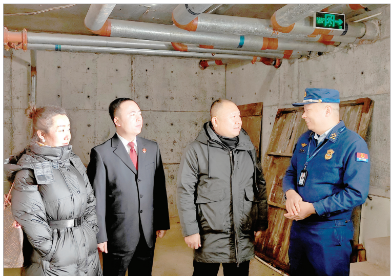
矿区人民检察院开展入企服务。

2024年5月,矿区人民检察院联合矿区人民法院前往华阳一矿,开展以“筑牢煤矿生产安全线”为主题的法治讲座,赋能企业高质量发展,持续提升企业运用法治思维和法治方法健康发展的能力和水平。 2024年7月,矿区人民检察院第一检察部干警分两批分别走进阳泉市新泉物流有限责任公司、山西森源晨机电有限公司,开展送法入企活动。 2024年9月,矿区人民检察院联合矿区工商联深入阳泉矿山化工有限公司,就营商环境、包联服务等开展入企服务。 …… 高质量发展离不开法治基础、法治动力、法治环境,2024年,矿区人民检察院深入贯彻落实“检察护企”专项行动,锚定矿区枢纽经济开发发展定位,创建“掘进矿检”检察工作品牌,全面履行检察职能,不断创新工作思路,完善工作机制,着力保障企业健康发展,构建亲清统一的新型企检关系,助推矿区经济社会高质量发展。