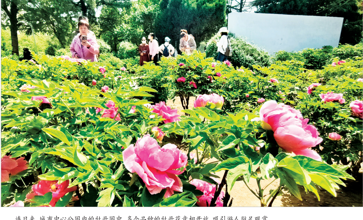
连日来，城市中心公园内的牡丹园中，多个品种的牡丹花竞相开放，吸引游人驻足观赏。图为4月19日，市民在园内打卡拍照。

下一步，公司将继续依托当地丰富的连翘资源，推动连翘茶产业发展壮大，让这一特色农产品走向更广阔的市场。（侯大旺）