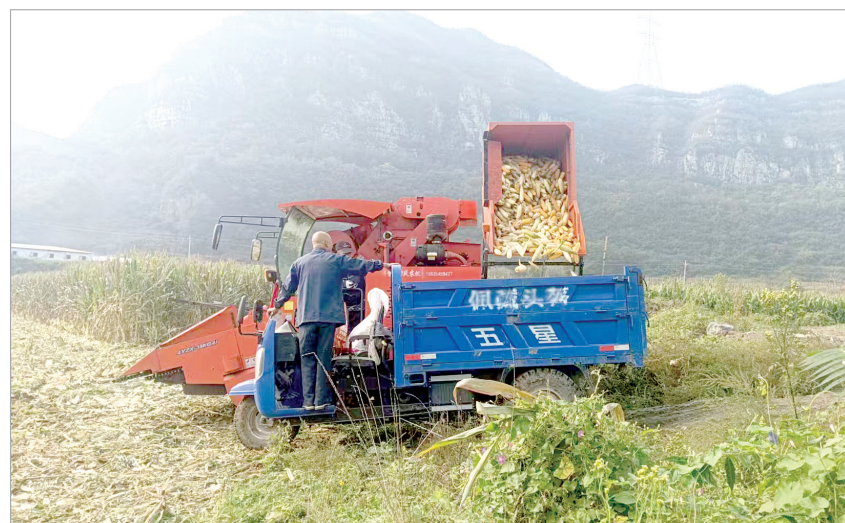
▲收获的玉米被集中转运

平定县是市农业大县之一。金秋时节,本是秋粮收获的好时候。然而,持续的阴雨天气对秋粮收获、储存,以及农作物播种造成不利影响。面对各种不利因素,平定县农业部门、各乡镇和农村、农业企业、种植大户等迅速行动,打响秋粮收获“保卫战”。平定县加会商研判频次,采取“政府统筹+农机支持+农户参与”的模式,对秋粮收获、烘干晾晒等多个环节严密部署,强化工作落实,确保服务到位。