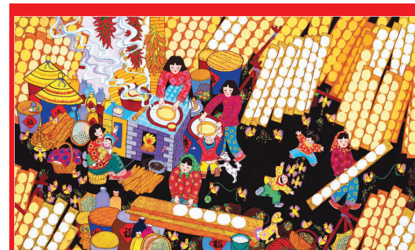
新生活 新风尚 新年画 我们的小康生活 蒸腾旧事 作者 任恩