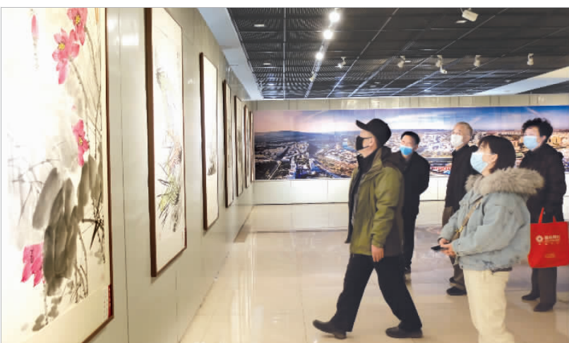
2月2日,首届“水墨漾泉”2021当代中国画名家邀请展在市展览馆举行。本次展览特邀全国15个省市的30多位当代中国画名家,创作近百幅彰显个人风格和地域文化的精品力作。本次展览到2月21日结束。

中学生家中,送去了米、面、油、奶、热水壶等生活用品和台灯等学习用品,同时送去了共青团组织的关怀和温暖。团员青年们表示,今后将不断创新方式,拓宽渠道,开展扶贫助困、心理健康咨询、健康义诊等丰富多彩的活动。