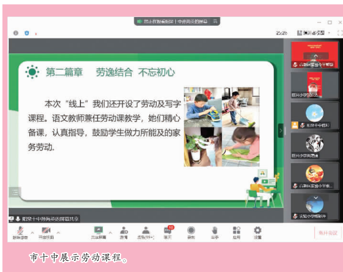
市十中展示劳动课程。

市十中学生在班级群里分享自己跟老师学的《抗击疫情》手势舞、世界杯舞蹈、《欢乐颂》手风琴演奏等,学生们沉浸在美妙的音乐里,脸上洋溢着灿烂的笑容。该校小学部在注重文化课的同时,十分关注音乐、体育、美术、劳动、书法等综合课程,通过科学合理编排课程,寓教于乐,促进学生全面发展。美术课上,可以动的手工蝴蝶、漂亮的花环、憨态可掬的小黄鸭,学