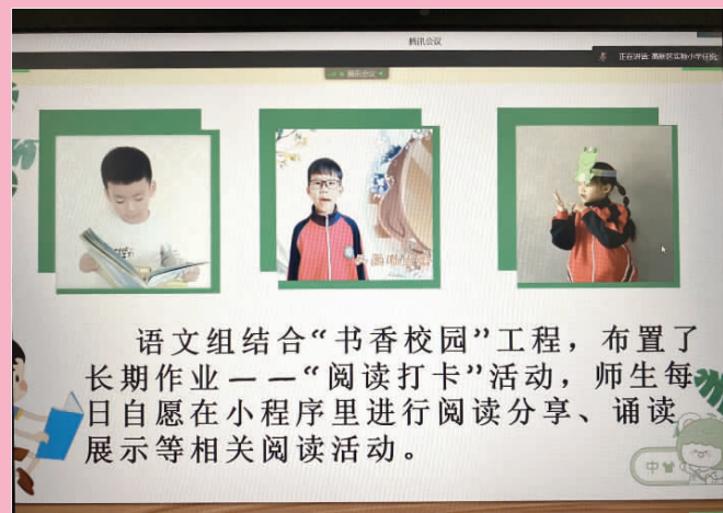
高新区实验小学展示学生阅读活动。